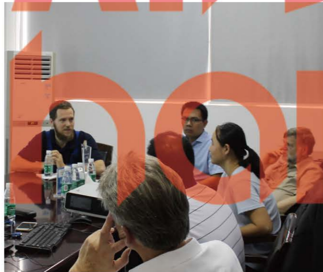
技术专家交流设计心得