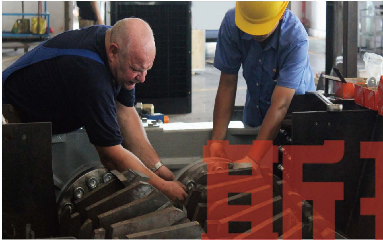
德国资深技工指导装配工艺