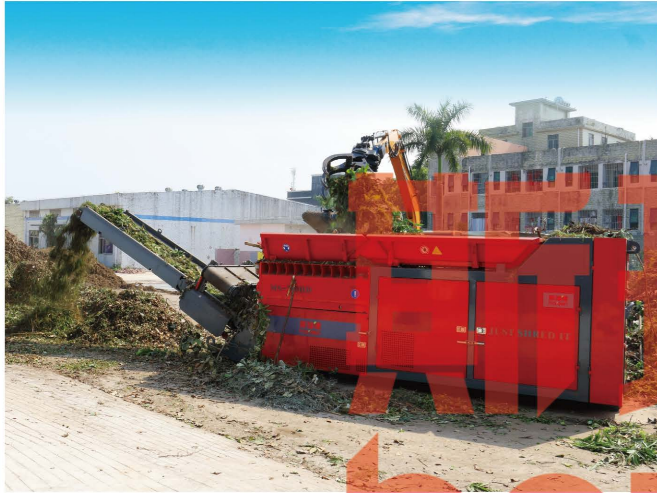
深圳园林绿化垃圾破碎处理