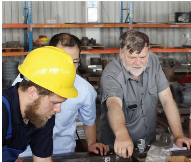
德国技术总监现场严格审查制造质量