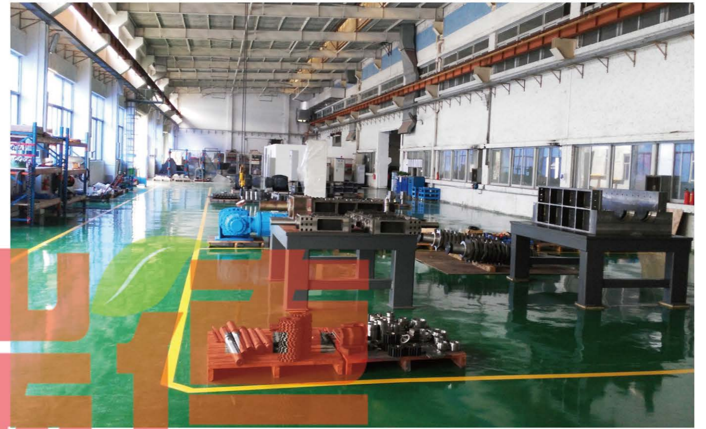
斯瑞德三号装配车间2卡，整洁、有序、美观