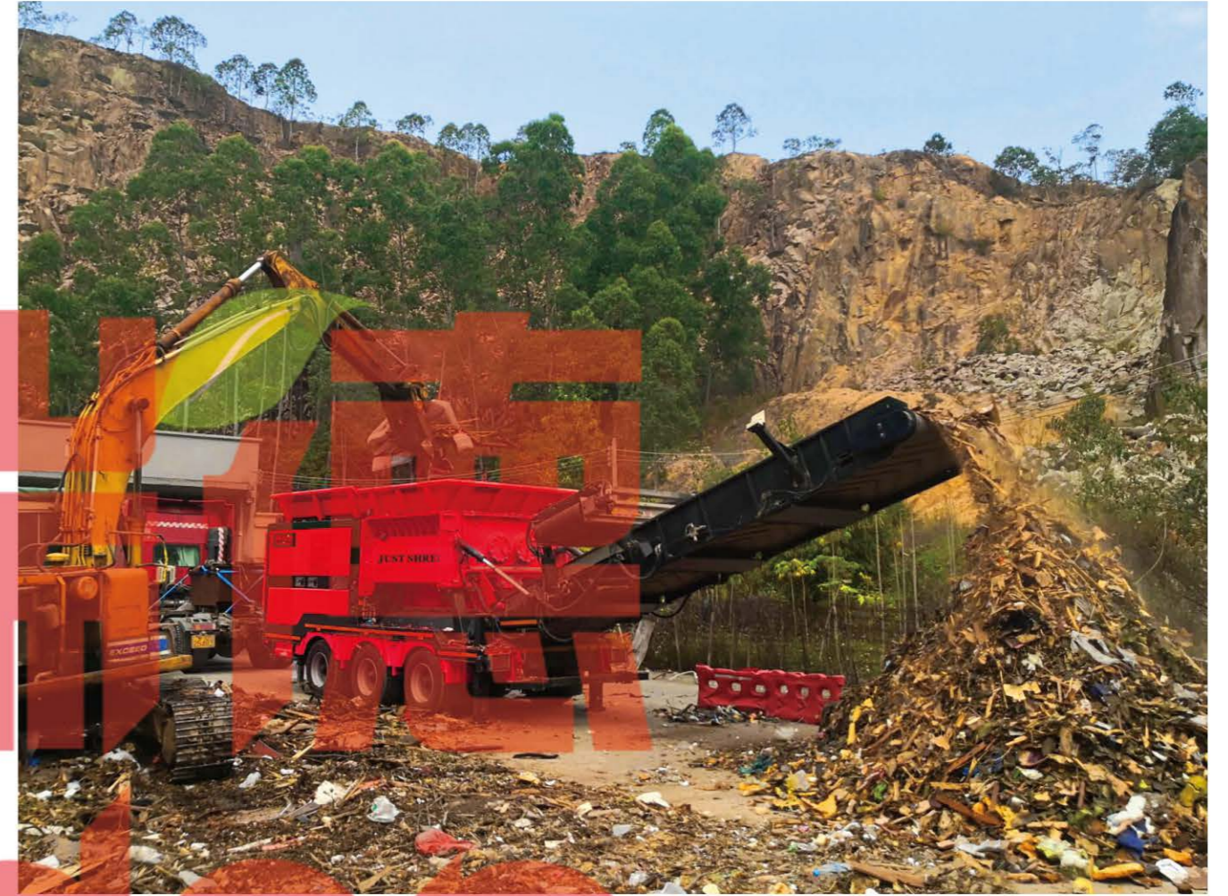
中山大件垃圾破碎处理